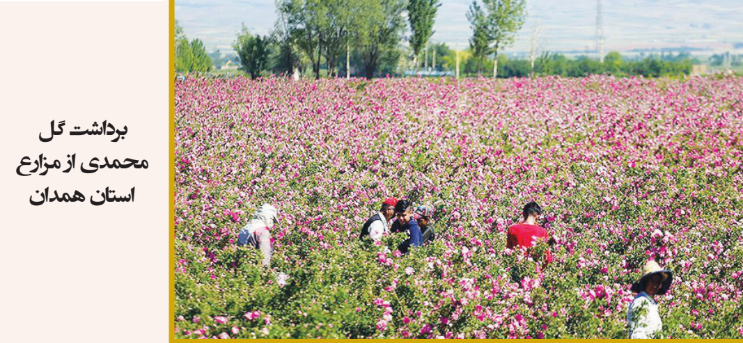
برداشت گل محمدی از مزارع استان همدان