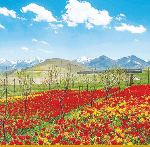
مزرحه گل های لاله در روستای اسپره خون تبریز