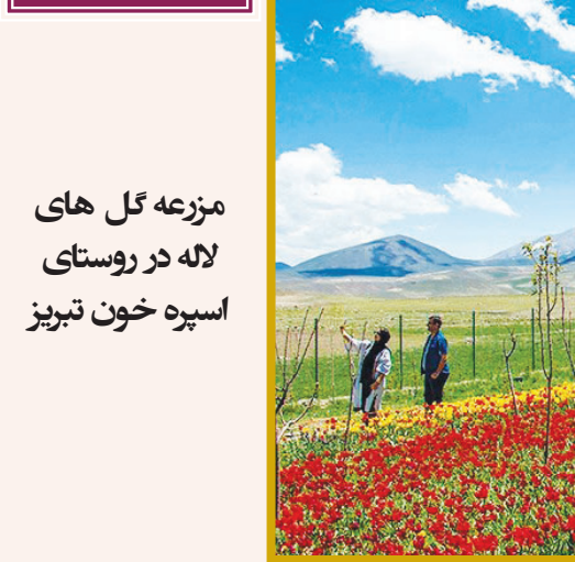
مزرحه گل های لاله در روستای اسپره خون تبریز