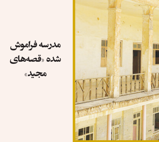
مدرسه فراموش شده «قصه‌های مجید»