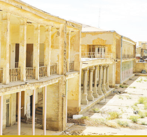
مدرسه فراموش شده «قصه‌های مجید»