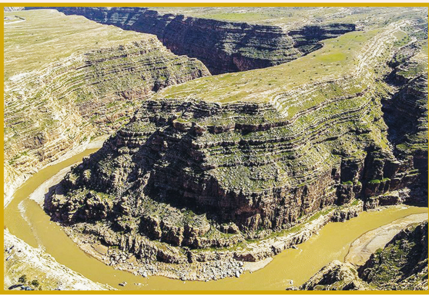
دره خزینه شهرستان پلدختر- لرستان