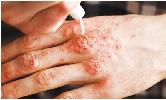
دکتر کوثر هدایت