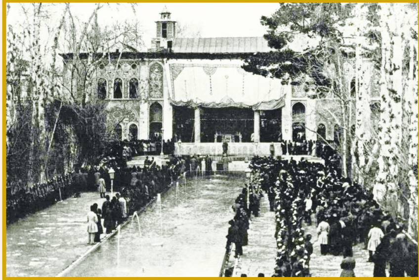
تصویر ایران قدیم بار عام شاهانه در نوروز