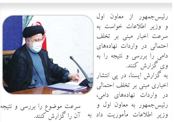
رئیس‌جمهور از معاون اول و وزیر اطلاعات خواست به سرعت اخبار مبنی بر تخلف احتمالی در واردات نهاده‌های دامی را بررسی و نتیجه را به وی گزارش کنند.