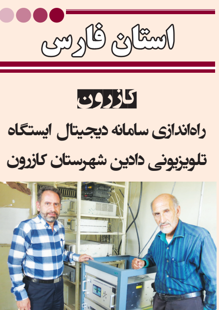
سامانه دیجیتال ایستگاه تلویزیونی دادین شهرستان کازرون راه‌اندازی شد.

به گزارش دریافتی روزنامه طلوع از روابط عمومی صداوسیما ی فارس، به همت مهندسان و متخصصان واحد فرستنده‌های تلویزیونی صداوسیما ی فارس و حمایت‌های اداره کل ستادی فرستنده‌های تلویزیونی و رادیویی اف ام سازمان، فرستنده دیجیتال ایستگاه تلویزیونی دهستان دادین از توابع بخش جره و بالاده شهرستان کازرون با فرمت DVB-T2 روی کانال ۳۵ راه‌اندازی شد.