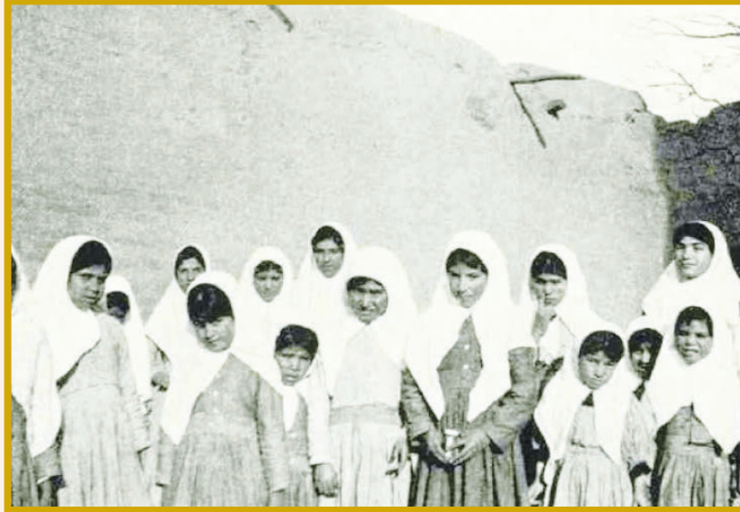
تصویر ایران قدیم دخترهای محصل