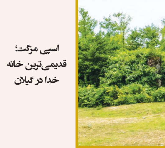
اسپی مرگت؛ قدیمی ترین خانه خدا در گیلان