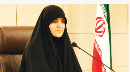
رئیس کمیسیون فرهنگی و اجتماعی شورای شهر شیراز هم