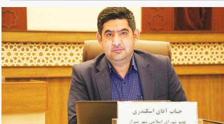
نامگذاری‌های ۶۰ درصد معیار از نام شدا