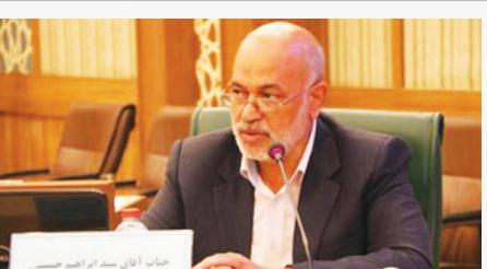
رئیس کمیسیون فرهنگی و اجتماعی شورای شهر شیراز هم