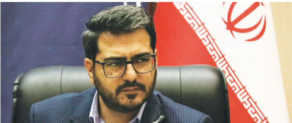
معاون هماهنگی امور زائرین و گردشگری استانداری فارس

مؤثر در رونق اقتصاد و اشتغال زیارت، معنویت افزایی