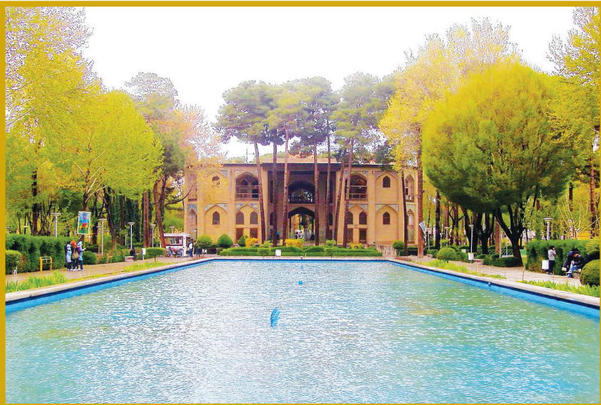
باغ بهشت اصفهان