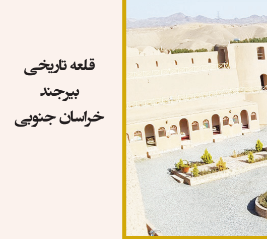
قلعه تاریخی بیرجند خراسان جنوبی