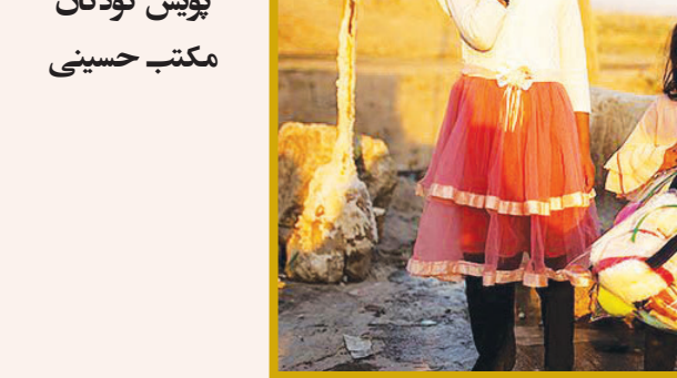
پویش کودکان مکتب حسینی