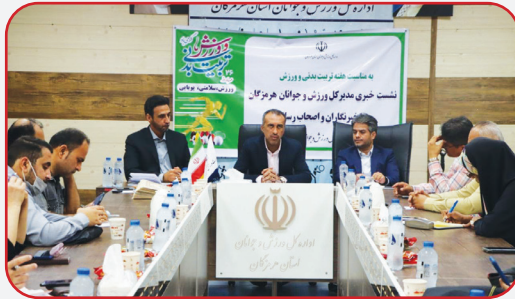
مدیرکل ورزش و جوانان هرمزگان گفت: در مصوبات سفر رئیس‌جمهور و هیئت دولت، ۹۰ میلیارد تومان به ورزش هرمزگان اختصاص یافت که مقداری از این بودجه مصوب و برخی هم تخصیص پیدا کرده است.

شهردار دزفول نیز در این نشست برای اجرای طرح‌های ورزشی قول همکاری و مساعد داد.