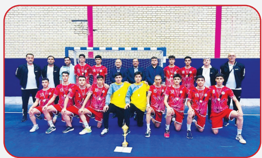
رقابت‌های هندبال قهرمانی نونهالان کشور با قهرمانی نماینده استان

کهگیلویه و بویراحمد به پایان رسید. به گزارش روزنامه طلوع به نقل از روابط عمومی فدراسیون هندبال، در روز پایانی مرحله نهایی رقابت‌های هندبال قهرمانی نونهالان کشور به میزبانی استان قزوین تیم فرازبام خائیز دهدشت با پیروزی ۳۳ بر ۲۵ مقابل فولاد مبارکه سپاهان اصفهان قهرمان این رقابت‌ها شد. همچنین در دیدار رده‌بندی ذوب آهن اصفهان با نتیجه ۲۵ بر ۲۳ مقابل نماینده هندبال استان قزوین به پیروزی رسید و جایگاه سوم را کسب کرد. این رقابت‌ها در راستای برنامه‌های استعدادیابی فدراسیون هندبال و سرمایه‌گذاری بر روی رده سنی پایه برگزار شد.