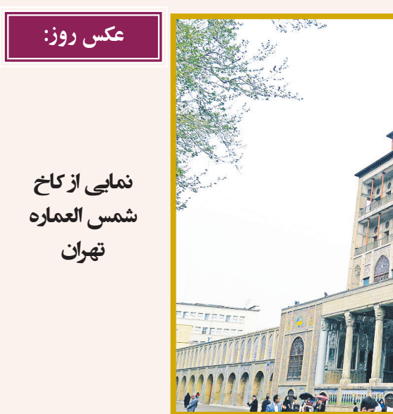
عکس روز: نمای از کاخ شمس‌العماره تهران

فیلم سینمایی «جنگ جهانی سوم» در ادامه حضور بین‌المللی خود در جشنواره «شب‌های سیاه تالین» کشور استونی به روی پرده می‌رود. به گزارش ایلنا، فیلم «جنگ جهانی سوم» ساخته هومن سیدی در بخش «بهترین‌های جشنواره» جشنواره بین‌المللی فیلم‌های شب‌های سیاه تالین در کشور استونی به نمایش گذاشته می‌شود. این فیلم که اخیراً جایزه ویژه هیئت داوران سی و پنجمین جشنواره فیلم توکیو را کسب کرده، نماینده رسمی سینمای ایران در شاخه بهترین فیلم بین‌المللی اسکار ۲۰۲۳ است و نخستین نمایش جهانی خود را در بخش افق‌های جشنواره ونیز تجربه کرد و جایزه بهترین فیلم و بازیگر مرد (محسن تنابنده) را به خود اختصاص داد.