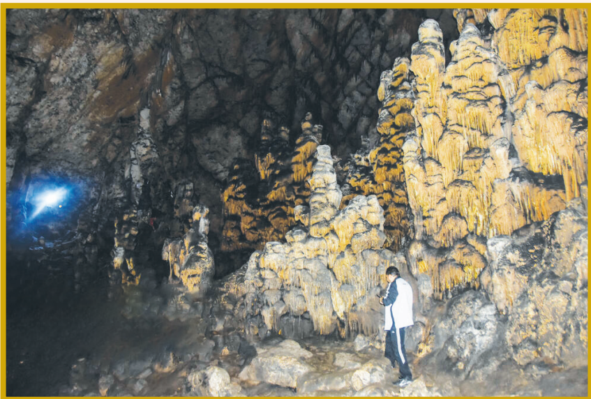
غار «دریند» دومین غار آهکی ایران