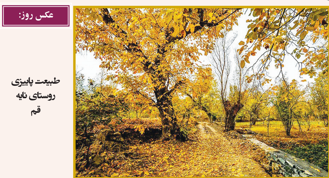
عکس روز: طبیعت پاییزی روستای نایه قم

گروهی از باستان‌شناسان موفق شدند مجموعه جدیدی از نقش‌های تاریخی مشهور به «خطوط نازکا» را در صحرایی واقع در کشور پرو کشف کنند. به گزارش مهر به نقل از آرت‌نت، گروهی از باستان‌شناسان ژاپنی دانشگاه «یاماگاتا» موفق شدند ۱۶۸ نقش معروف به «خطوط نازکا» را در صحرای نازکا واقع در جنوب «پرو» کشف کنند. تاکنون صدها نقش مرمرز در ابعاد عظیم در این صحرای پرو کشف شده است که بیشتر آن‌ها فقط از نمای هوایی قابل مشاهده‌اند. نقش‌هایی که اخیراً در «صحرای نازکا» کشف شده‌اند، شتر، انسان، پرنده، نهنگ، گربه و مار را به تصویر می‌کشند و گمان می‌رود که قدمت آن‌ها به فاصله ۱۰۰ پیش از میلاد تا ۳۰۰ میلادی برسد. ابعاد برخی از این نقش‌ها سه تا شش متر است و احتمالاً به همین دلیل دیرتر از سایر نقش‌های مشابه کشف شده‌اند. طول بزرگ‌ترین نقش در بین «خطوط نازکا» به ۳۵ متر می‌رسد. این گروه تحقیقاتی به سرپرستی استاد رشته مردم‌شناسی و باستان‌شناسی دانشگاه «یاماگاتا» و با همکاری یک باستان‌شناس اهل پرو، این نقش‌های باستانی را کشف کردند. کاوشگران برای