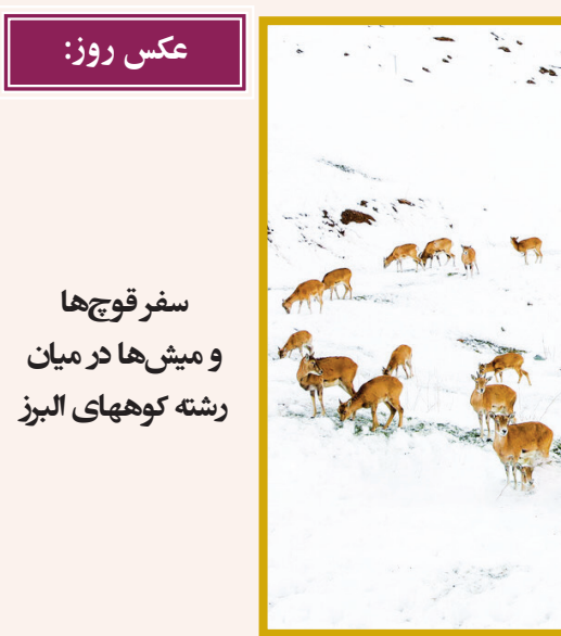
عکس روز: سفر قوچ‌ها و میش‌ها در میان رشته کوه‌های البرز