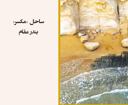
ساحل «مکسو» بندر مقام