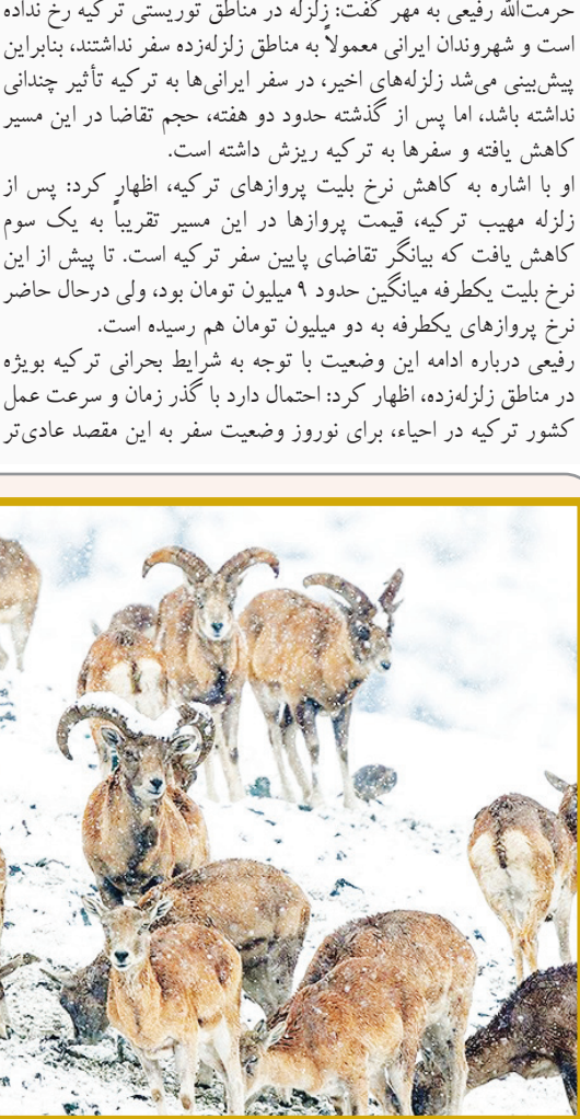
قوچ‌ها و میش‌های گلدوک