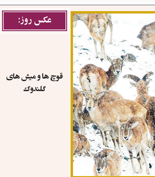
قوچ‌ها و میش‌های گلدوک