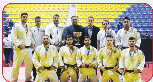
افغانستان حضور داشتند.

در بخش تیم‌های داخلی نیز، تیم رعد پدافند بوشهر، نیروی زمینی ارتش ج.ا.ا، نفت مسجد سلیمان، شاهین تهران، خوشگوار مشهد، مس کرمان و خانه جودو ملک هفت تیم داخلی حاضر در این رقابت‌ها بودند که نماینده شایسته بوشهر مقام قهرمانی را کسب کرد. این رقابت‌ها با حضور ۶ داور بین‌المللی خارجی و ۱۲ داور ایرانی برگزار شد.