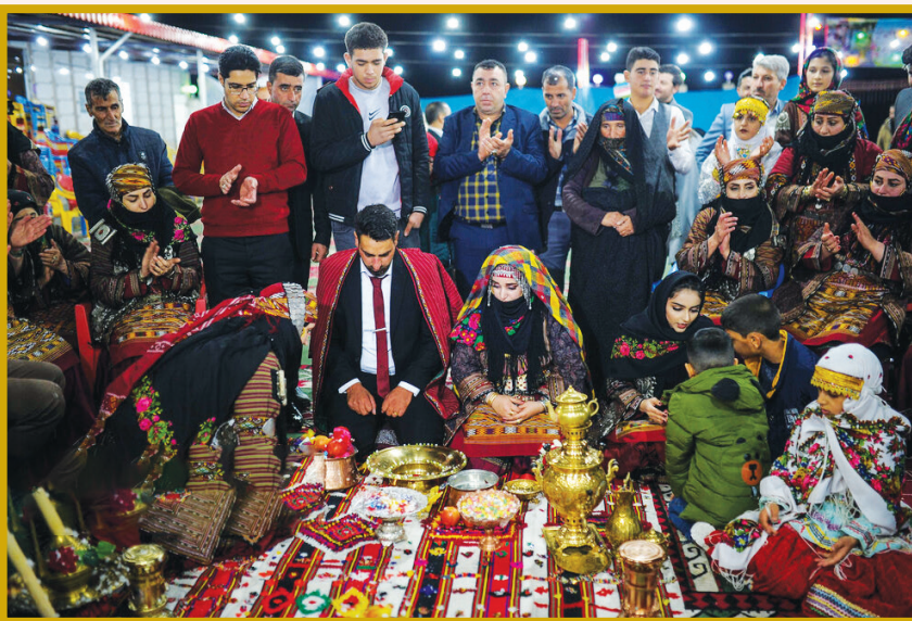
عروسی کرماتجی (داوه تا کرماتجی)