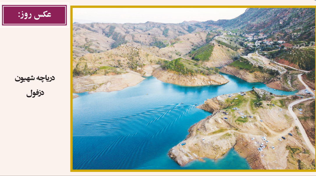
عکس روز: دریاچه شهیون دزفول