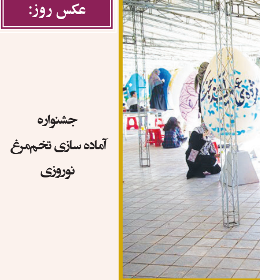
عکس روز: جشنواره آماده سازی تخم مرغ نوروزی

رئیس ستاد مرکزی خدمات سفر همچنین نحوه خدمت‌رسانی در ایام ماه مبارک رمضان را به‌صورت یکپارچه و اجرای برنامه‌های فرهنگی مرتبط را ضمن هماهنگی کامل با استانداران، در دستور کار ادارات کل استانی قرار داد. معاون گردشگری در ادامه، آمارگیری روزانه و ثبت در سامانه‌ها را نیز یکی دیگر از امور اجرایی مهم نوروزی خواند و بر کیفیت آمار اخذ شده و نیز بهره‌مندی از آن در امری از جمله پیش‌بینی وضعیت و تحلیل سفرها تأکید کرد. در این وینار مدیریت نحوه اطلاع‌رسانی، در نظر گرفتن سنگین استان برای ارائه اطلاعات یکپارچه از سطح استان و نیز تسریع در ارائه گزارش‌های نظارتی به عنوان جمع‌بندی نهایی مطرح شد و تلاش برای مطالبه‌گری از تمامی مقامات و نهادهای فرابینشی استانها به‌صورت