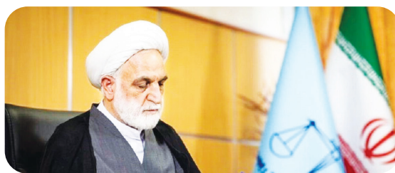
قیمت دیه کامله در ماه‌های غیر حرام برای سال ۱۴۰۱، ۶۰۰ میلیون تومان تعیین شده بود.

رئیس قوه قضاییه در بخشنامه‌ای به همه واحدهای قضایی و دادرشاهای سراسر کشور نرخ دیه سال ۱۴۰۲ را ابلاغ کرد. رئیس قوه قضاییه در بخشنامه‌ای به همه واحدهای قضایی و دادرشاهای سراسر کشور نرخ دیه سال ۱۴۰۲ را ابلاغ کرد. به گزارش ایرنا، به موجب ابلاغ بخشنامه حجت‌الاسلام والمسلمین غلامحسین محسنی اژه‌ای به همه واحدهای قضایی و دادرشاهای سراسر کشور با توجه به بررسی‌های به عمل آمده و در راستای اجرای ماده ۵۴۹ قانون مجازات اسلامی، مصوب سال ۱۳۹۲، قیمت دیه کامله در ماه‌های غیر حرام برای سال ۱۴۰۲ مبلغ ۹ میلیارد ریال معادل ۹۰۰ میلیون تومان تعیین شد.