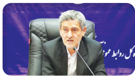
استاندار فارس خیر ۵۱۵:

اجرای طرح نظرسنجی کارکنان دولت به صورت QR code از سال آینده