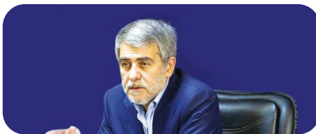
فریدون عباسی نماینده مجلس: