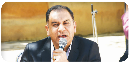
شهردار منطقه سه شیراز خبر داد؛