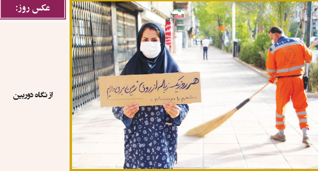
از نگاه دوربین