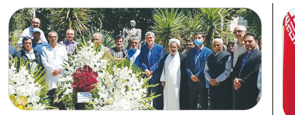
استاندار فارس در حاشیه گرامیداشت پنجاه و یکمین سالگرد درگذشت مرحوم نمازی:

سوم: از ابتدای شروع به کار چنین «شهرک گردشگری» باید تبلیغاتی گسترده در سطح جهان صورت گیرد و روز به روز همزمان با پیشرفت این پروژه، گردشگران جهان را از اهمیت آن آگاه ساخت. بدین ترتیب هنگام اتمام این طرح و آماده شدن برای افتتاح و بهره‌برداری، همه گردشگران دنیا را جهت شرکت در مراسم افتتاحیه آن با تحفیفات و مشوق‌هایی دعوت کرد تا در آینده، هم منبع عظیم درآمد و ثروت برای استان و کشور شود و هم به ترویج فرهنگ و هنر و تاریخ کشورمان در سطح جهان بینجامد. البته همه اینها مدیریتی جامع و استراتژیک با همتی بلند می‌طلبد.