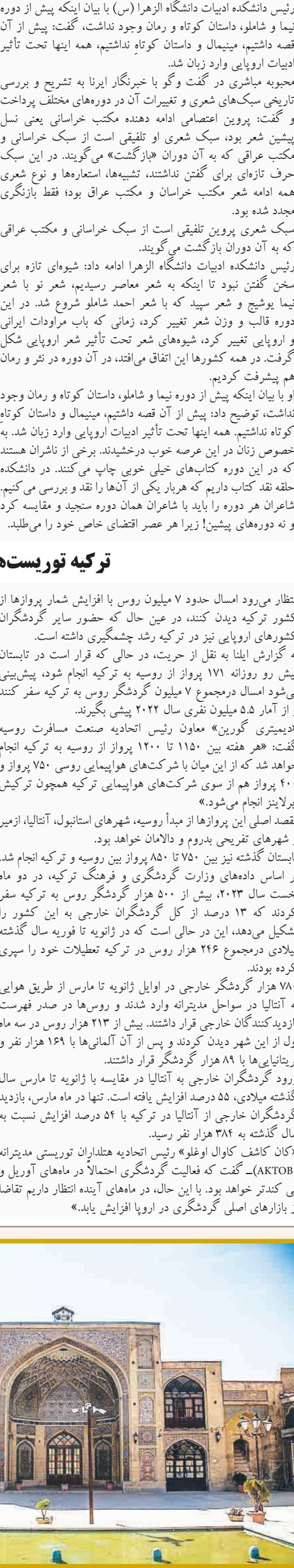
مسجد عمادالدوله کرمناشاه