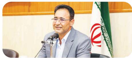
شهردار منطقه پنج شیراز در مصاحبه اختصاصی با طلوع خبر داد:

ایمن‌سازی کمربندی شیراز، با احداث بزرگترین پل جنوب کشور در منطقه پنج