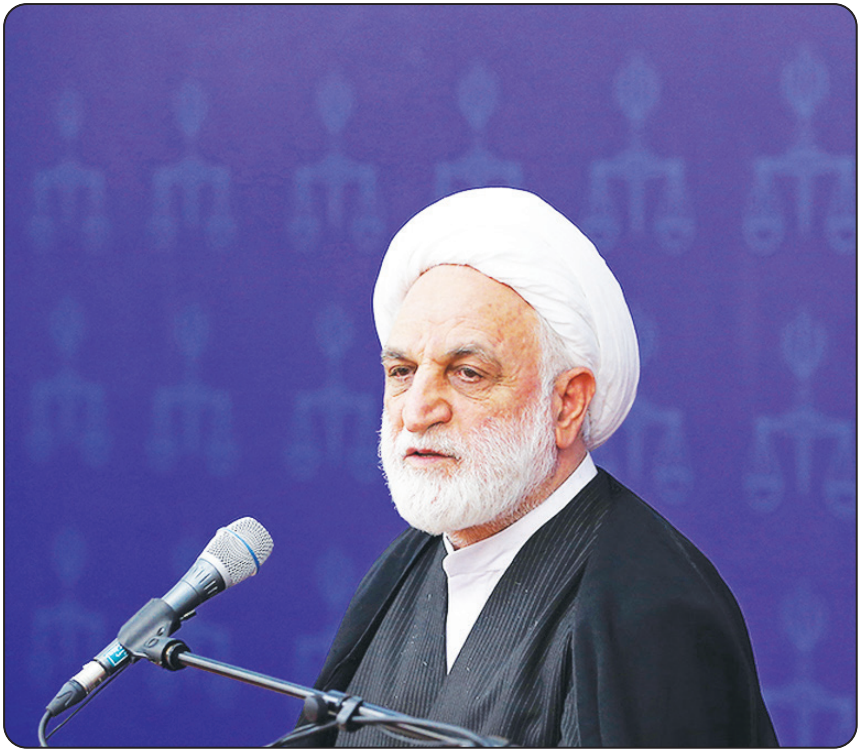
نائب رئیس کمیسیون آموزش:

هشدار نسبت به افزایش احتمالی قیمت کتاب‌های درسی و فشار مالی به اقشار ضعیف