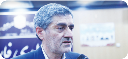
استاندار فارس در حاشیه جلسه شورای راهبردی تصادفات:

تحلیل این خبر را در ستون «تحلیل خبر» بخوانید