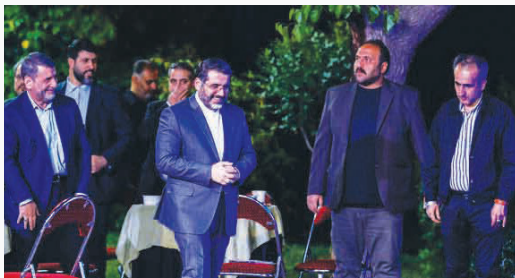
تراز انقلاب اسلامی رخ خواهد داد.