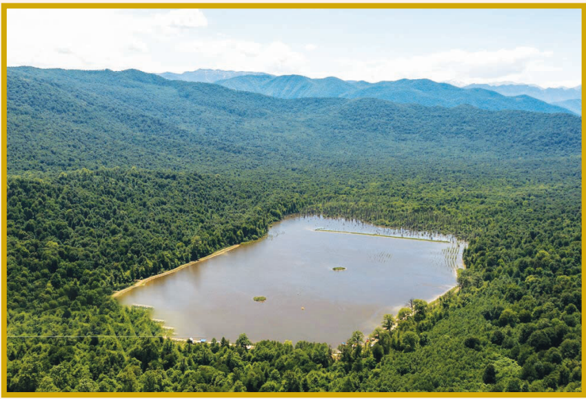
درباره ندان یا «آب‌بندان پله ازنی» شهرستان ساری