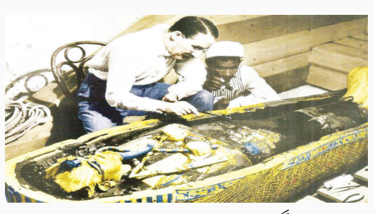
مصر باستان فراگیر شد.