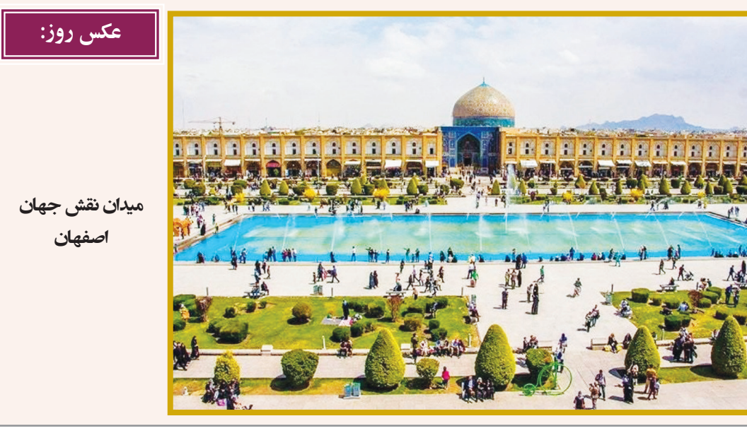
میدان نقش جهان اصفهان

فیلم «سه کام حبس» به کارگردانی سامان سالور اگرچه محصول سال ۱۳۹۸ است و در سی‌و‌هشتمین جشنواره فیلم فجر رونمایی شده بود اما سرانجام از اردیبهشت امسال در کنار فیلم «شیراز» در این جشنواره حضور یافت. سالور در این باره گفت: «ما ساختن فیلمی که به نفع خودش صحبت می‌کند؛ البته که من نمی‌خواهم. ما می‌خواهیم به نفع آن‌ها صحبت می‌کند؛ البته که من نمی‌خواهم. ما می‌خواهیم به نفع آن‌ها صحبت می‌کند؛ البته که من نمی‌خواهم.»