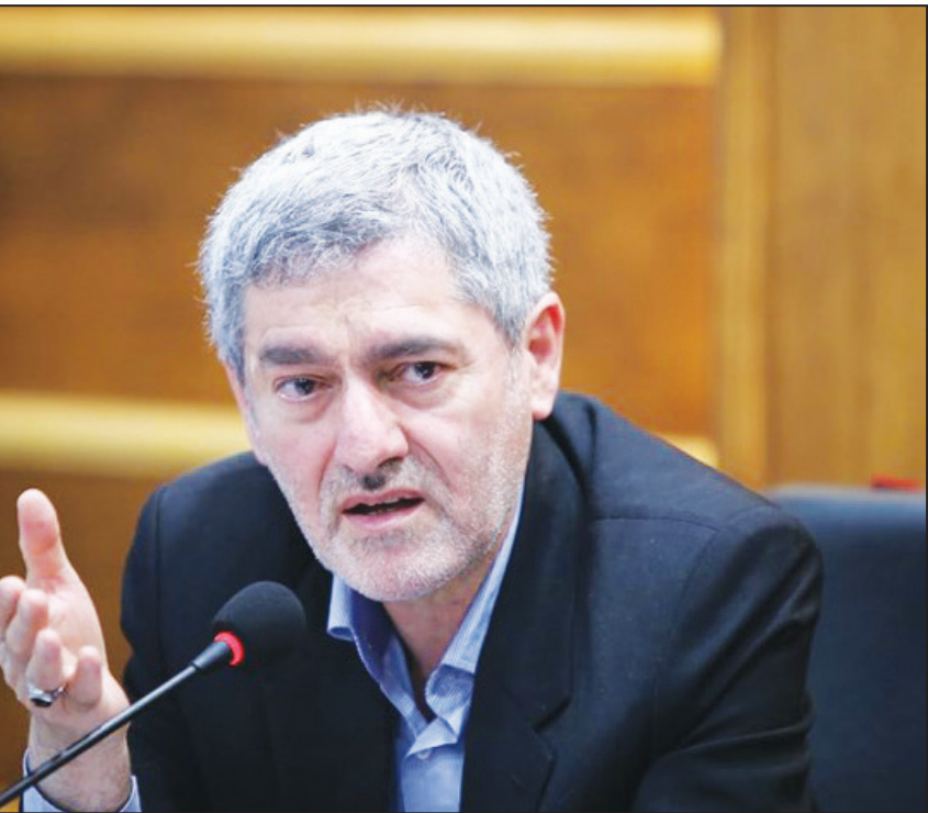
رئیس قوه قضائیه

تحلیل این خبر را در ستون «تحلیل خبر» بخوانید