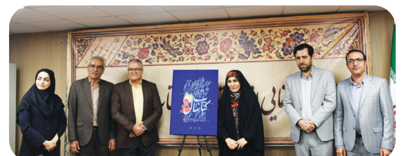
همزمان با روز قلم اجرا شد؛