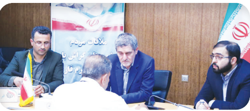
استاندار فارس تاکید کرد؛