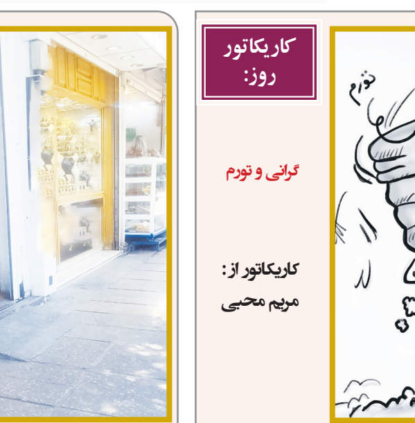
کاریکاتور روز: گرمی و تورم کاریکاتور از: مریم محبی