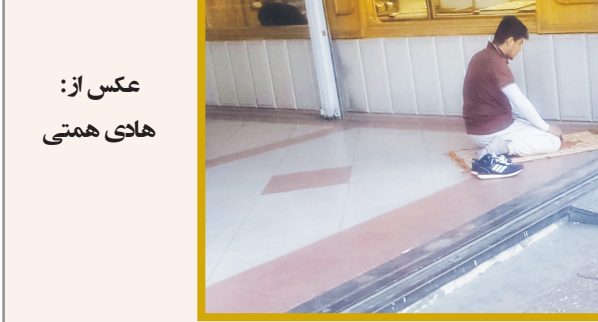
عکس روز: نماز اول وقت در کنار خیابان

همچنین گردشگران می‌توانند پس از بازدید و سیر و سیاحت در این منطقه از امکانات اسکان، غذاهای محلی و نوشیدنی‌های اردوگاه خهکلون استفاده کنند.