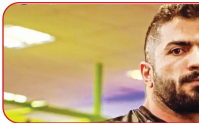
ورزشکار گچسارانی در مسابقات بدنسازی و پرورش اندام باشگاه‌های شهرستان گچساران، افتخارآفرینی کشور افتخارآفرینی کرد.

به گزارش خبرگزاری صدا و سیما کهنکلیویه و بویراحمد، رئیس اداره ورزش و جوانان گچساران گفت: در مسابقات بدنسازی و پرورش اندام، بادی بیلدینگ و فیتنس