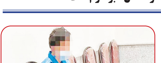
به گزارش صد آتلاین، چند روز پس از درگیری سرنشینان دو موتورسیکلت که به قتل یکی از آنها منجر شده بود، پسری جوان به جرم قتل عمدی دستگیر شد اما ادعا کرد که قاتل برادرش است نه او.

شامگاه بیست و نهم تیرماه امسال گزارش یک درگیری مرگبار به قاضی وحید ناصری، بازپرس ویژه قتل تهران مخابره شد. بررسی‌ها نشان می‌داد درگیری میان ۲ موتورسوار بر سر برخوردی ساده که میان آنها رخ داده بود، باعث قتل یکی از آنها که جوانی ۲۷ ساله بود شده است. مأموران با بررسی دوربین‌های مداربسته پلاک موتور قاتل را شناسایی و صاحب آن را دستگیر کردند. او اما در بازجویی‌ها قتل را انکار کرد. مرد بازداشت شده ادعا کرد که قتل را برادرش مرتکب شده و او بی‌گناه است اما مدارک و شواهدی در صحنه قتل به‌دست آمده که احتمال دست داشتن وی در قتل را پررنگ کرده است. در این شرایط متهم بازداشت شده و تحقیقات در این پرونده جنایی ادامه دارد.