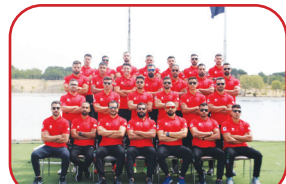
تیم سکان بوشهر نایب‌قهرمان لیگ برتر دراگون‌بوت آقایان با هدف حضور در مسابقات قهرمانی جهان عازم تایلند شد.