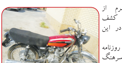
فرمانده انتظامی جهرم از دستگیری سارق و کشف موتورسیکلت سرقتی در این شهرستان خبر داد.

به گزارش دریافتی روزنامه طلوع از پلیس فارس، سرهنگ خسرو رزمجویی اظهار داشت: مأموران بگان امداد هنگام گشت رانی در سطح حوزه استحفاظی به راکب یک دستگاه موتورسیکلت که در حال تردد بود مشکوک و آن را متوقف کردند.