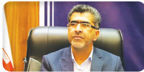
سرپرست معاونت سیاسی، امنیتی و اجتماعی استانداری فارس: