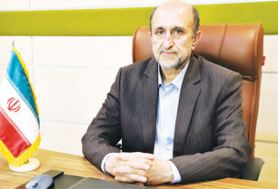
دانشگاه علوم پزشکی شیراز موفق شد در رتبه بندی سال ۲۰۲۳

دانشگاه علوم پزشکی شیراز با حدود ۱۰ هزار دانشجو در رشته‌ها و مقاطع تحصیلی مختلف و نزدیک به هزار عضو هیئت علمی و ۱۷ دانشکده مستقر در شیراز و شهرستان‌های استان فارس، دارای حدود هشت دهه پیشینه آکادمیک بوده و به عنوان یکی از دانشگاه‌های تراز اول کشور شناخته می‌شود.