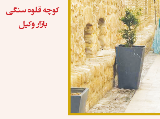
کوجه قلوه سنگی بازار وکیل

در این تکه کاغذ دست‌نوشته به «لنی» و «جورج» که دو شخصیت اصلی این کتاب محسوب می‌شوند، اشاره شده است. علاوه بر این دفتر وقایع روزانه «اشتاین‌بک» که به سال ۱۹۴۹ میلادی تعلق دارد نیز در این حراجی به فروش گذاشته خواهد شد.