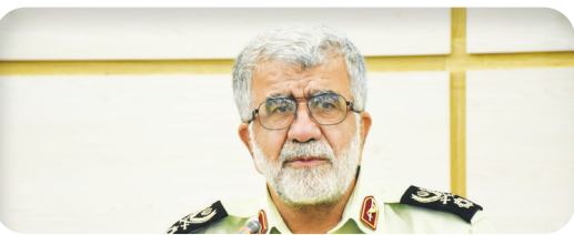
فرمانده انتظامی استان فارس: