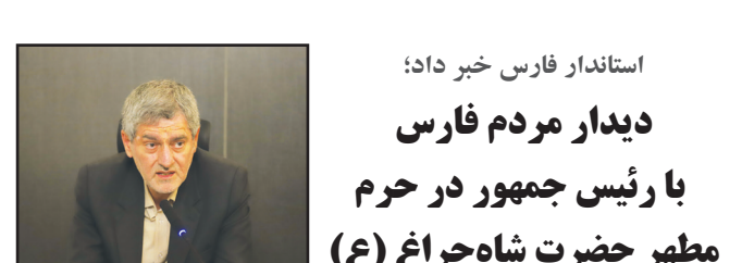
استاندار فارس خبر داد: دیدار مردم فارس با رئیس جمهور در حرم مطهر حضرت شاهچراغ (ع)