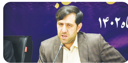
مدیرکل فرهنگ و ارشاد اسلامی استان فارس خبر داد:

کشف حدود ۲۳ تن انواع مخدر طی ۶ ماه امسال در استان فارس