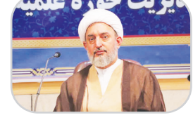
حجت الاسلام والمسلمین حاج ابوالقاسم دولایی

نصرالله پناهی: حجت الاسلام والمسلمین حاج ابوالقاسم دولایی، در نشستی با مسئولان نهادهای حوزوی استان فارس که در مدیریت حوزه علمیه استان برگزار شد، با اشاره به فعالیت‌های دولت اظهار کرد: اخیراً مرکزی تحت عنوان مرکز ارتباطات دولت و روحانیت با رسالت‌های مهمی راه‌اندازی شده است. وی به رسالت‌های مرکز ارتباطات دولت و روحانیت اشاره کرد و افزود: مرکز ارتباطات دولت و روحانیت به ایجاد هماهنگی میان دولت و روحانیت می‌پردازد و تلاش می‌کند تا علما، فضلا و طلاب از ظرفیت‌ها و اقدامات طرفین مطلع شوند. مشاور رئیس‌جمهور با بیان اینکه نظرات علما به دولت منعکس می‌شود، تصریح کرد: رئیس‌جمهور، وزرا و معاونان رئیس‌جمهور از نقطه نظرات علما و روحانیون آگاه می‌شوند، همچنین این مرکز به آموزش‌های بصیرتی و دینی به کارکنان دولت ارائه خواهد داد. وی از دیگر اقدامات مرکز ارتباطات دولت و روحانیت را جمع‌آوری راهبردهای حوزویان در بخش‌های مختلف متناسب با اقدامات دولت، از جمله فرهنگی دانست و ادامه داد: رئیس‌جمهور اهتمام جدی به استفاده از نظرات طلاب و روحانیون دارد. مشاور رئیس‌جمهور در امور روحانیت همچنین از راه‌اندازی نمایشگاهی در قم خبر داد و عنوان کرد: برای معرفی اقدامات دولت، به زودی نمایشگاهی در قم برگزار می‌شود که امکان برگزاری این نمایشگاه در استان‌ها نیز وجود دارد. رئیس مرکز ارتباطات دولت و روحانیت درباره نمایشگاه روایت خدمت هم گفت: مردم، ولی‌نعمت ما هستند و باید بدانند خدامان آنها چه اقداماتی انجام داده‌اند. دولت سیزدهم در بیان اقدامات خود به قوت عمل نکرده و سبب شده تا دشمنان ما در فضای مجازی این موضوع را القا کنند که دولت خدماتی انجام نداده است و وقتی مردم مطلع نباشند، غبار