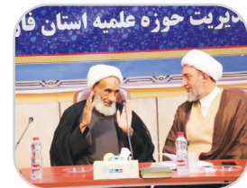
آیت الله بهشتی در دیدار با مدیران هیئت دولت

نصرالله پناهی: آیت الله احمد بهشتی در دیدار نهادهای حوزوی فارس با مشاور رئیس جمهور در امور روحانیت که در مرکز مدیریت حوزه علمیه فارس برگزار شد، درخصوص قدمت حوزه علمیه فارس اظهار کرد: با توجه به سابقه و جغرافیایی دارای وسعت بسیاری است از این رو دارای ۷۶ امام جمعه است. وی در ادامه با اشاره به روایتی از امیرالمؤمنین (ع) اضافه کرد: باید با خدا کارها را پیش ببریم، اگر آخرت خود را درست کنیم خداوند دنیای ما را درست خواهد کرد، انسان باید در مرحله اول واعظ خود سپس واعظ دیگران باشیم. عضو مجلس خبرگان رهبری نیز تصریح کرد: موضوع تورم زندگی مردم را دچار مشکل کرده است، دولت در این زمینه باید چاره‌ای بیابد، این شاء الله در این زمینه موفق خواهد شد. وی در پایان متذکر شد: باید از فرصت‌ها برای حل مشکلات اقتصادی و تورم استفاده کرد. فعالیت ۷۶ امام جمعه در استان فارس و حجت الاسلام عادل حاجی پور مدیر شورای سیاستگذاری ائمه جمعه فارس هم در این نشست اظهار کرد: استان فارس از نظر وسعت