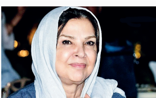
انجام کارهای روزمره از سوی او شده است.

انجام کارهای روزمره از سوی او شده است. عکس روز: فصل خزان در ارتفاعات شهرستان رامیان استان گلستان