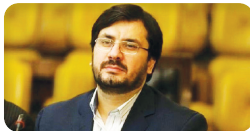
وزیر راه و شهرسازی خبر داد: