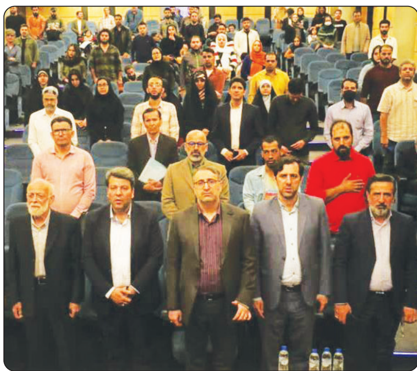
مدیر روابط عمومی شرکت توزیع نیروی برق استان فارس تشریح کرد: