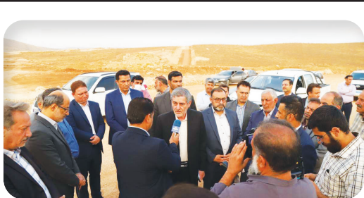
استاندار فارس خبر داد:

کلانشهر شیراز قابلیت میزبانی از یک جشنواره ملی سینمایی را دارد