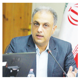
معاون بازرسی سازمان صمت استان فارس خبر داد: