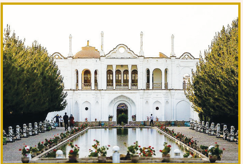
باغ فتح آباد کرمان